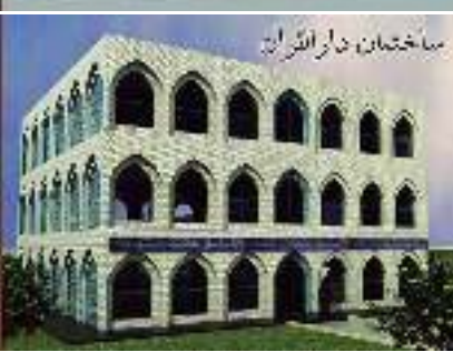
سما ختمان، دارالافتاء