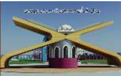
زین العابدین امام حسینؑ کے سرکاری قبرستان